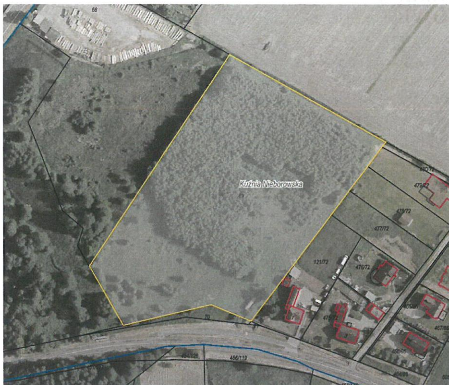
Rys. nr 1 Obszar przeznaczony do dzierżawy oznaczono kolorem żółtym

Zgodnie z danymi ujawnionymi w ewidencji gruntów i budynków, na powierzchnię działki przeznaczonej do dzierżawy składają się następujące użytki: